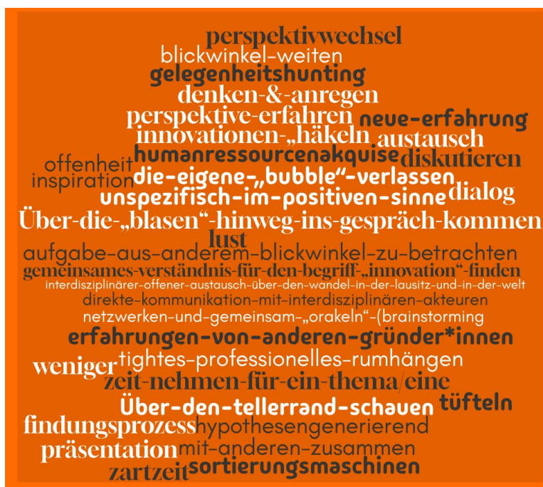
Abb 1: Was Leute tun, wenn sie innovakeln

Kooperationsbeziehungen auf Zeit können dann Konsensetappen produzieren, die kein dauerhaftes Commitment erfordern und Unterschiede nicht überwinden, sondern etappenförmig nutzen können in dem das schmale Segment von proaktiven Wissensträger:innen/Gestalter:innen, die bleiben und verschiedenste Akteursgruppen gelernt haben zu begleiten. Aus Anwendungswissen wird Prozesswissen über verlässliches und wiederholbares Engagment/Commitment gewonnen. Dieses Wissen verortet und verbindet sich allerdings erst durch aktives Involviertsein und kann verstärkend und verstetigend durch Wiederholung zu Beziehungswissen und -vertrauen werden. In diesen Verflechtungen beziehen sich Menschen aufeinander und praktizieren Regionssinn.